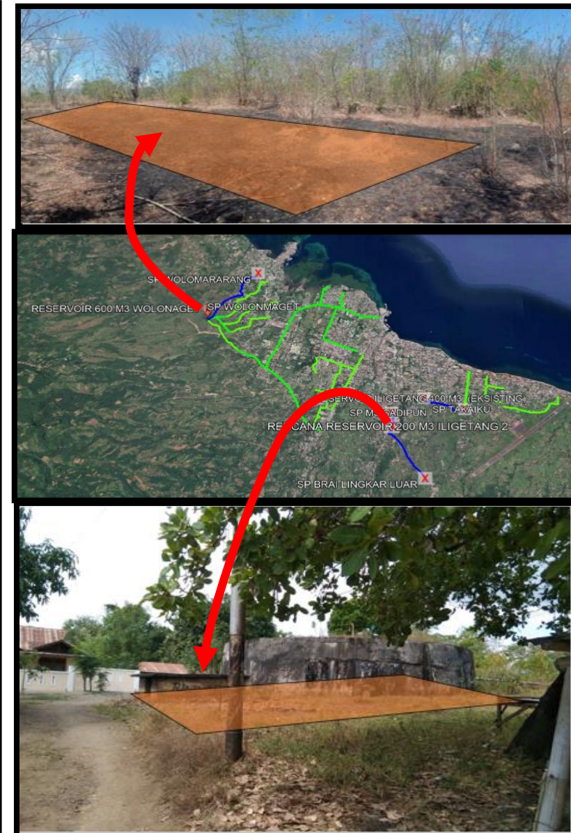
RENCANA PEMBANGUNAN RESERVOAR 600 M3 dan 200