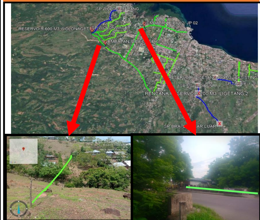
LOKASI RENCANA JEMBATAN PIPA 1 & 2