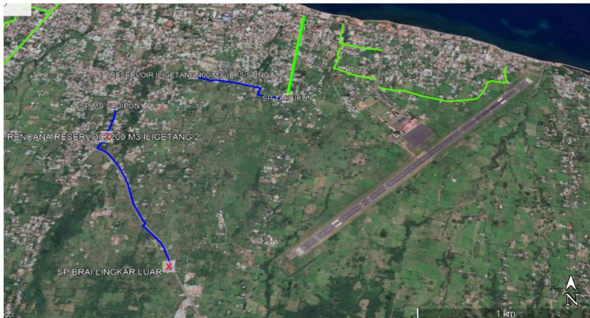
Jalur Pipa Transmisi dan Jaringan Pipa Distribusi Zone 3